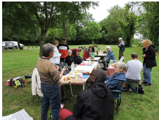
À gauche, sortie œcuménique le 26 mai 2022