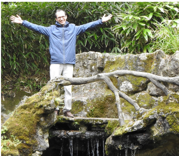
En sortie avec l'Entraide au parc Majolan : un futur pasteur heureux !