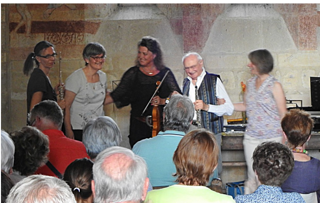
Cressac le 8 août 2023 Concert Clavibois