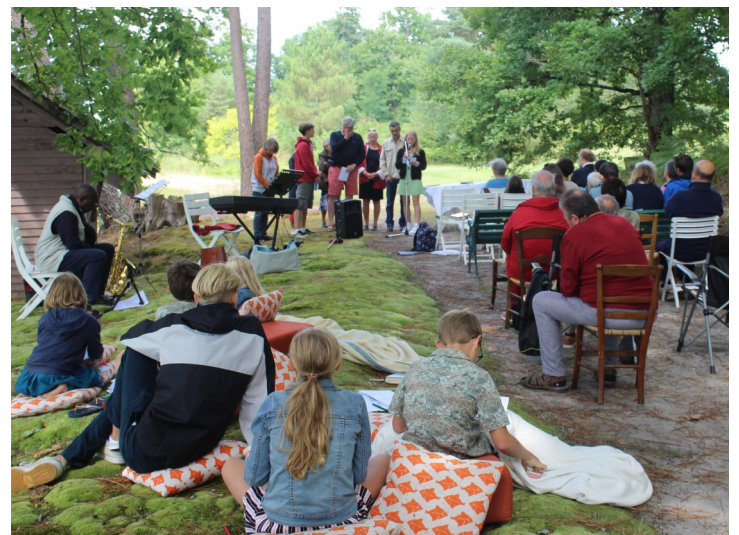
Saint-Maigrin le 6 août 2023