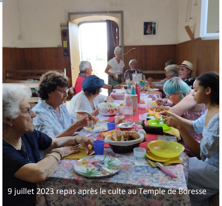
9 juillet 2023 repas après le culte au Temple de Boresse