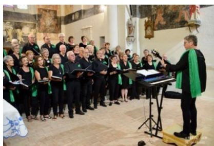
16h30, CONCERT Accords et à Cœur Dir. Christelle Méchain Participations libres aux frais