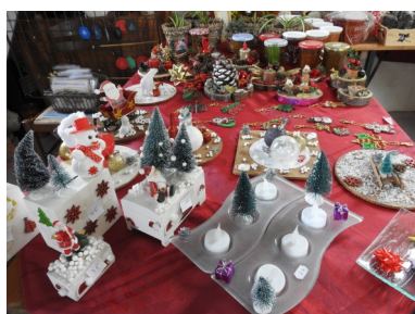
MARCHE DE NOEL, A partir de 10h