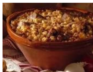
19h, DINER Sur inscription, au 0650060863